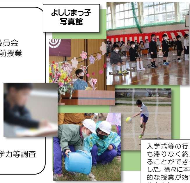
よじまっ子 写真館

入学式等の行事も滞りなく終わることができました。徐々に本格的な授業が始まります！